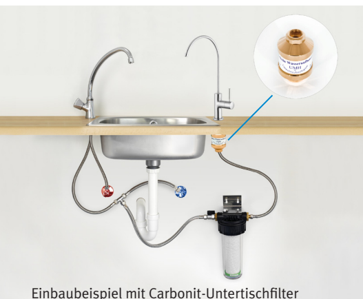
Einbaubeispiel mit Carbonit-Untertischfilter

Ich möchte mich bei Ihnen auf diesem Weg recht herzlich für ein echtes Stück Lebensqualität bedanken. Ich benutze Ihre Produkte mittlerweile seit mehr als zwei Jahren. Sie wissen von meinem Wunsch mich möglichst natürlich zu ernähren, und ich kann heute wirklich sagen, dass ich mich mit meinem Wasser sehr sicher fühle. Mit meinem Untertischfilter bin ich bis heute ausgesprochen zufrieden. Den „Frischekick“ des UMH Wirblers genieße ich wie am ersten Tag. Ich möchte heute kein anderes Wasser mehr trinken.